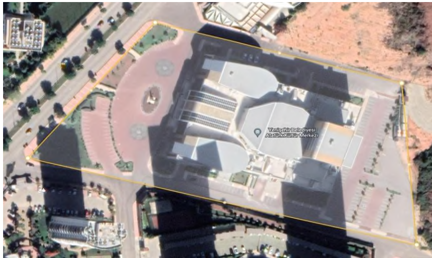
Şekil 4 Yenisehir Belediyesi Atatürk Kültür Merkezi Güneş Enerji Santrali Proje Sahası