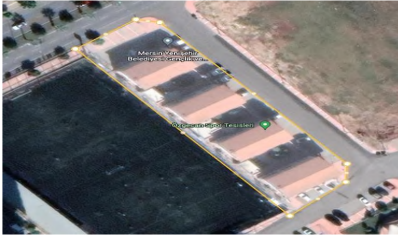
Şekil 3 Yenisehir Belediyesi Özgecan Etüd Merkezi Güneş Enerji Santrali Proje Sahası