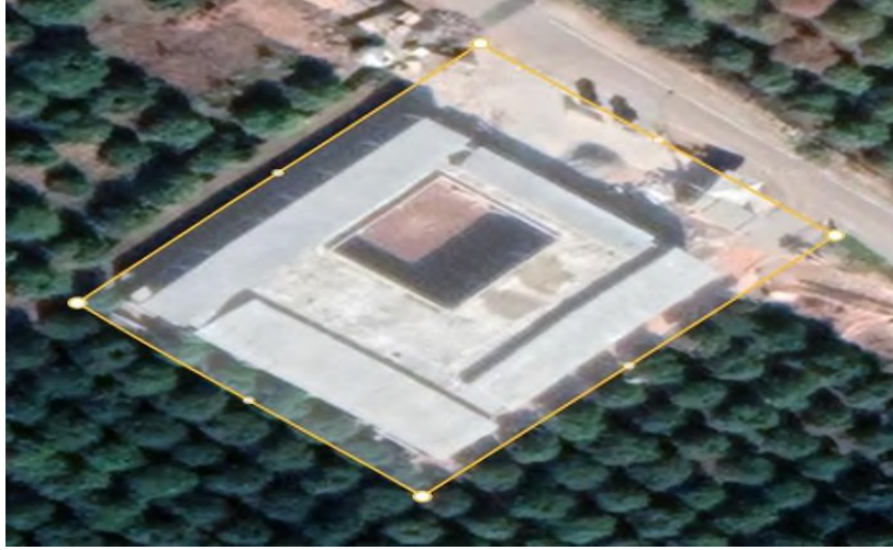
Şekil 2 Yenisehir Belediyesi BETEM Güneş Enerji Santrali Proje Sahası